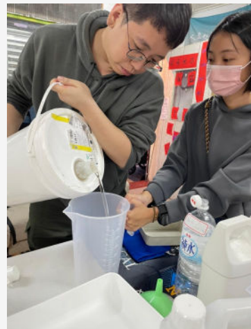
R-Clean公益捐贈 X 台灣社區實踐協會